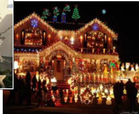
...aber bitte nicht soo...!

Wir wünschen euch und uns noch einen bunten Herbst, eine geruhsame Adventszeit und dass wir im nächsten Jahr wieder öfter zusammenkommen.